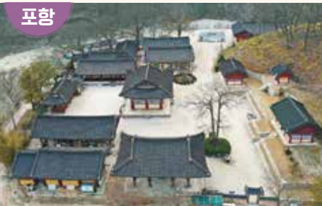
경상북도 포항시 남구 오천읍 오어로 1