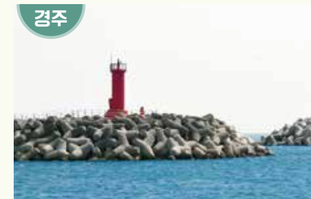
경상북도 경주시 감포읍 감포리