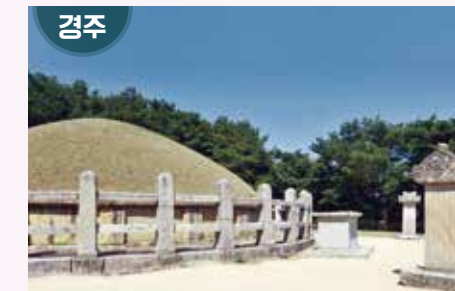
경상북도 경주시 충효2길 44-7