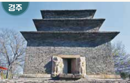
경상북도 경주시 분황로 94-11