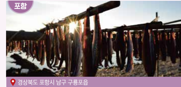
경상북도 포항시 남구 구룡포읍