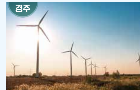
경상북도 경주시 양북면 불국로 1655