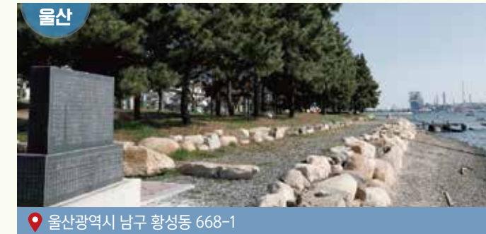
울산광역시 남구 황성동 668-1