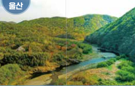
울산광역시 울주군 대곡천 일대