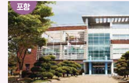
경상북도 포항시 남구 동해면 일월로 41번길 19