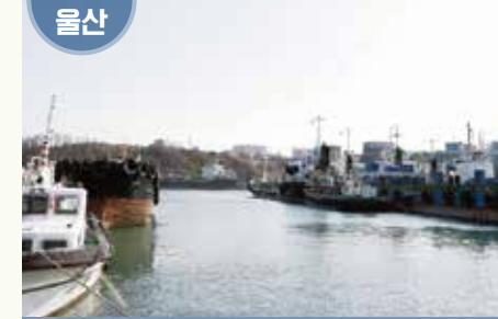
울산광역시 남구 장생포동