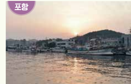
경상북도 포항시 남구 구룡포읍