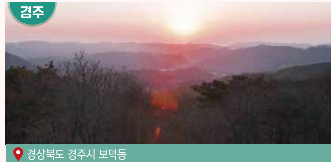
경상북도 경주시 보덕동