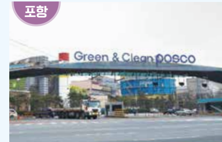
경상북도 포항시 남구 동해안로 6261