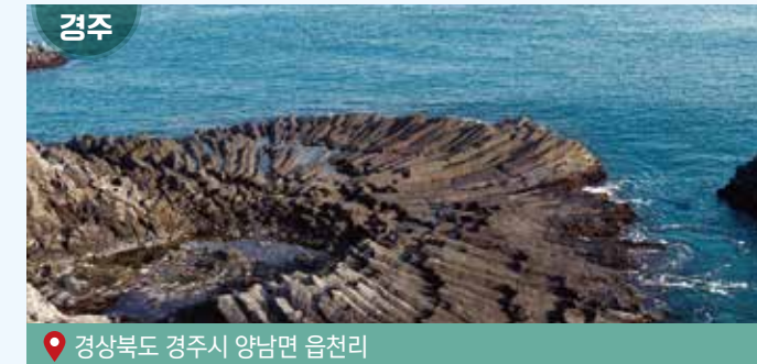
경상북도 경주시 양남면 읍천리