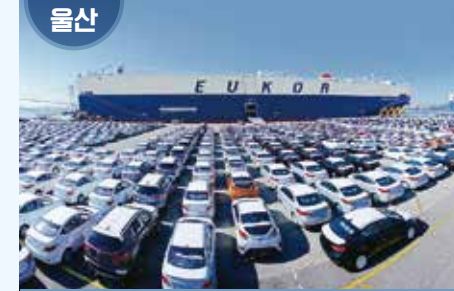
울산광역시 북구 염포로 700