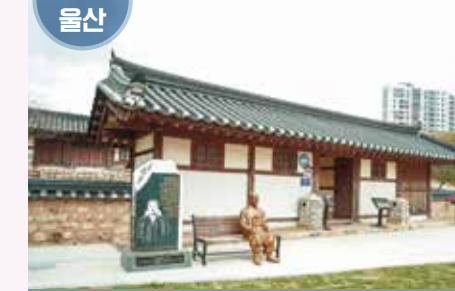
울산광역시 북구 박상진길 23